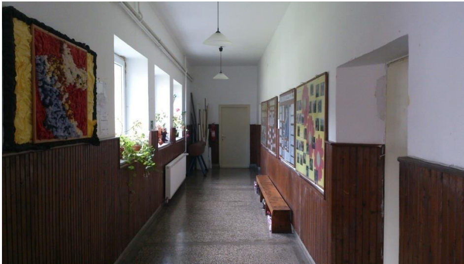
Panoi za prikaz učeničkih radova u prostoru Matične škole u Klancu