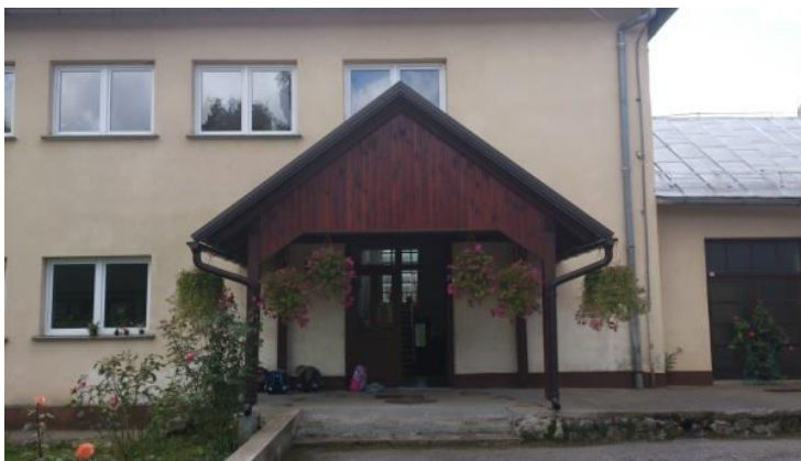
Ulaz u Matičnu školu Klanac